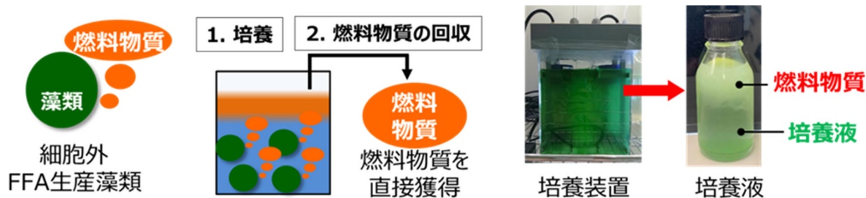
図3 開発した細胞外 FFA 生産藻類の燃料生産イメージ(左)と培養の様子(右)