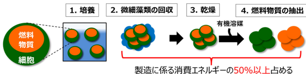
図1 従来のバイオ燃料製造フロー

自然界に生息する微細藻類の中には、油脂などの燃料物質を細胞内に生産・蓄積できる細胞内油脂生産藻類 *1 が存在します。この燃料物質は、ジェット燃料やディーゼル燃料の原料として利用できるため、こうした微細藻類を用いたバイオ燃料生産に関する研究が世界的に進められています。従来、藻類バイオ燃料の製造では、培養した微細藻類を回収・乾燥させた後、細胞内に蓄積された燃料物質を有機溶媒などで抽出していました(図1)。しかし、この工程では製造に係る消費エネルギー全体の50%以上を占めており、実用化に向けて消費エネルギーの低減が重要な課題でした。